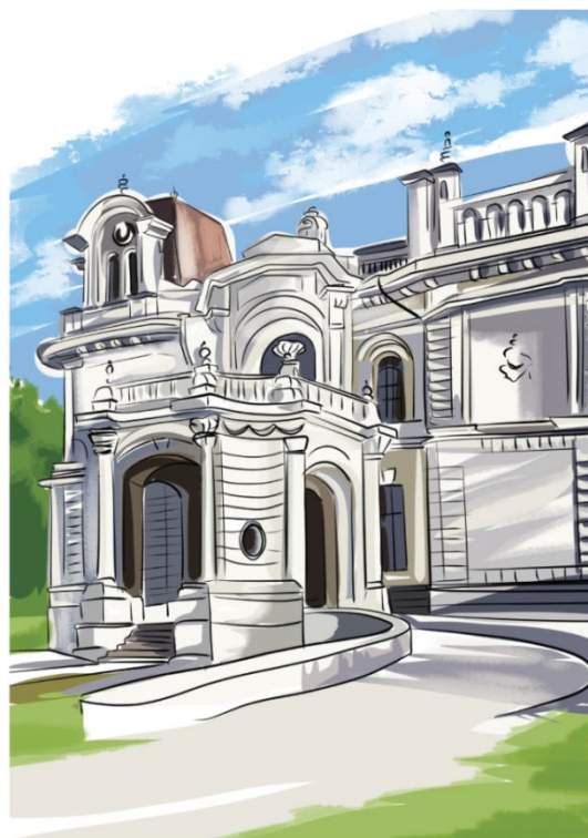
Рис. 2. Разворот путеводителя Fig. 2. The spread of the guidebook

«Усадьба Асеева». (Тамбовская обл., г. Тамбов, ул. Набережная/ул. Гоголя, 22 /1)