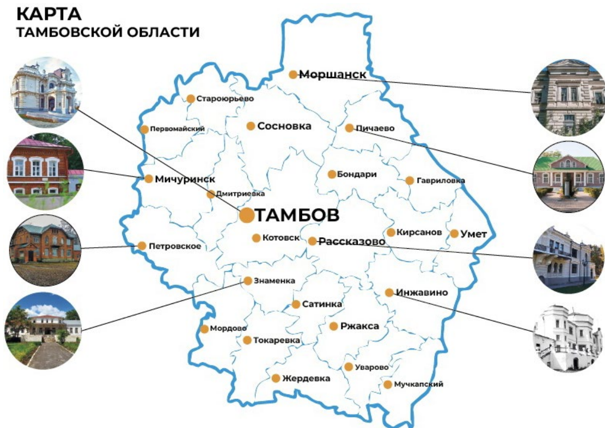
Рис. 5. Усадьбы на карте Тамбовской области Fig. 5. Estates on the map of the Tambov region