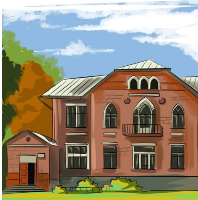
Рис. 4. Иллюстрация. Усадьба Чичериных в с. Покровское Fig. 4. Illustration. Chicherin estate in the village of Pokrovskoye